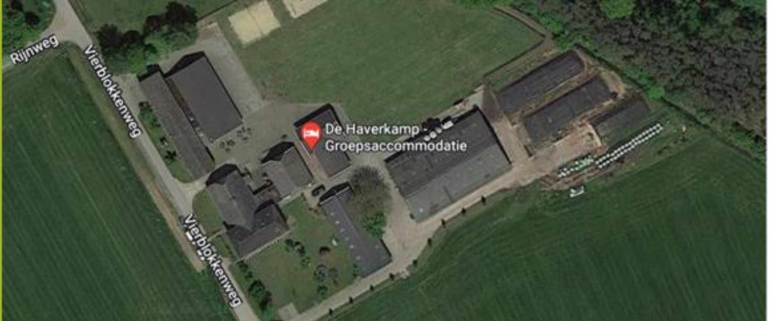
De Haverkamp – Hengelo (Gelderland)