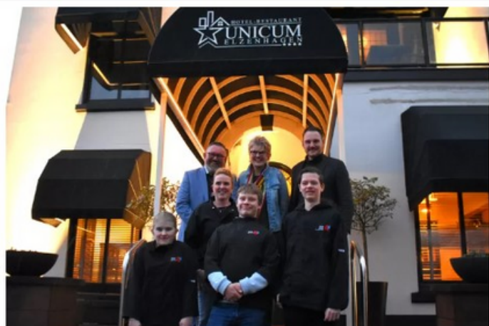
▲ In de maanden januari, februari en maart zet Restaurant Unicum Elzenhagen de deuren open voor Westlanders die extra behoefte hebben aan 'verbinding en meer kleur in hun dagen'.

Op maandag 18 maart zet Sweelincklaan zit weer in bij Unicum, maar dan een andere docent, andere leerlingen en andere gasten. Wordt vervolgd in de volgende nieuwsbrief.